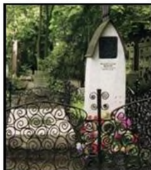
Памятник на могиле писателя

Летом 1904 года Чехов выехал на курорт в Германию. Скончался он 2 (15) июля 1904 года в Баденвайлере.