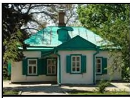
Домик А. Чехова в Таганроге

Апрель 1890 г. – отъезд на остров Сахалин, остров царской каторги и ссылки. Это путешествие было подвигом писателя. Поездка через всю страну, пребывание на Сахалине, оставило глубокий след в его творческом сознании.