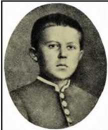
В гимназические годы

А. П. Чехов родился 29 января 1860 в Таганроге в семье купца. "В детстве у меня не было детства... я родился, вырос, учился и начал писать в среде, в которой деньги играют безобразно большую роль", - вспоминал позднее Чехов.