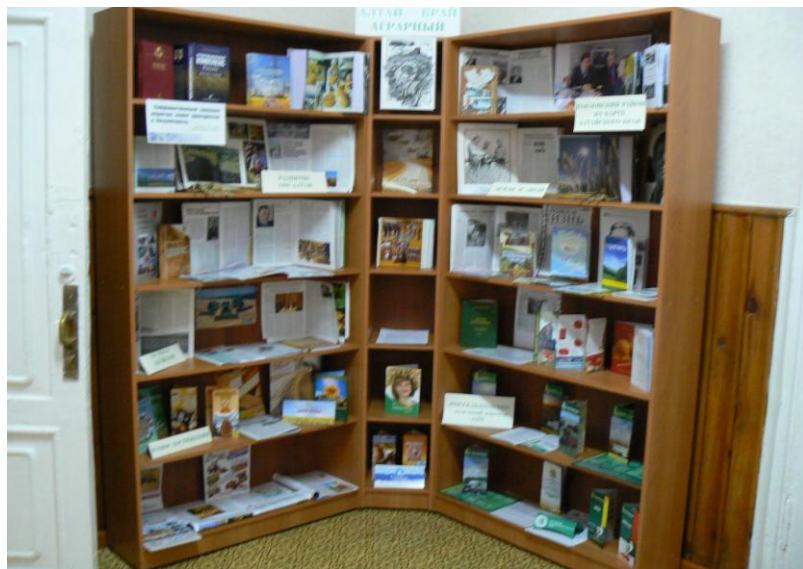
Выставка в фойе библиотеки «Алтай – край аграрный»

Для пользователей центра оформлены выставки: «Алтай – край аграрный», «Аграрный путь России» - выставка новинок, выставка-презентация «Павловский район на сельскохозяйственной карте края» - публикации о предприятиях и людях района.