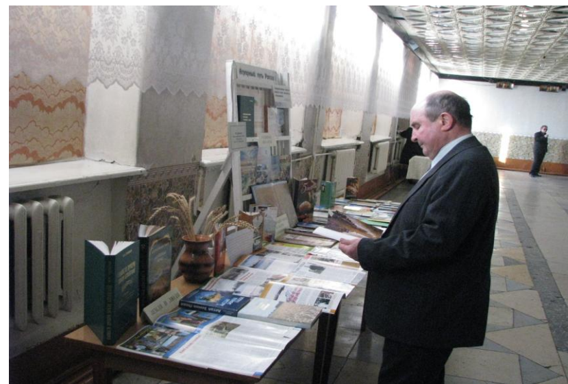
Выставка-просмотр на Дне работника сельского хозяйства и перерабатывающей промышленности в фойе ДК «Юность»

Практикуем выездные выставки-просмотры, где представляем новинки и информацию об информационных услугах центра.