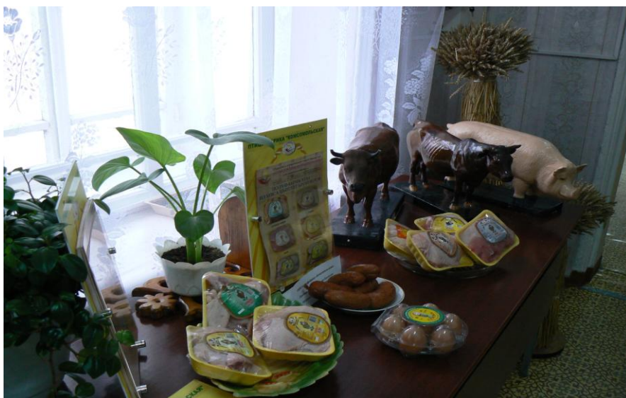
Фрагменты выставки «Павловская нива»

Участие в выставке приняли «Черемновский сахарный завод», «Павловский маслосырзавод», ООО «Птицефабрика Комсомольская», СПК «Альянс», фермеры и индивидуальные предприниматели. Выставка получила большой интерес у посетителей библиотеки