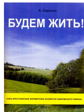
книга о Союзе К(Ф)Х района