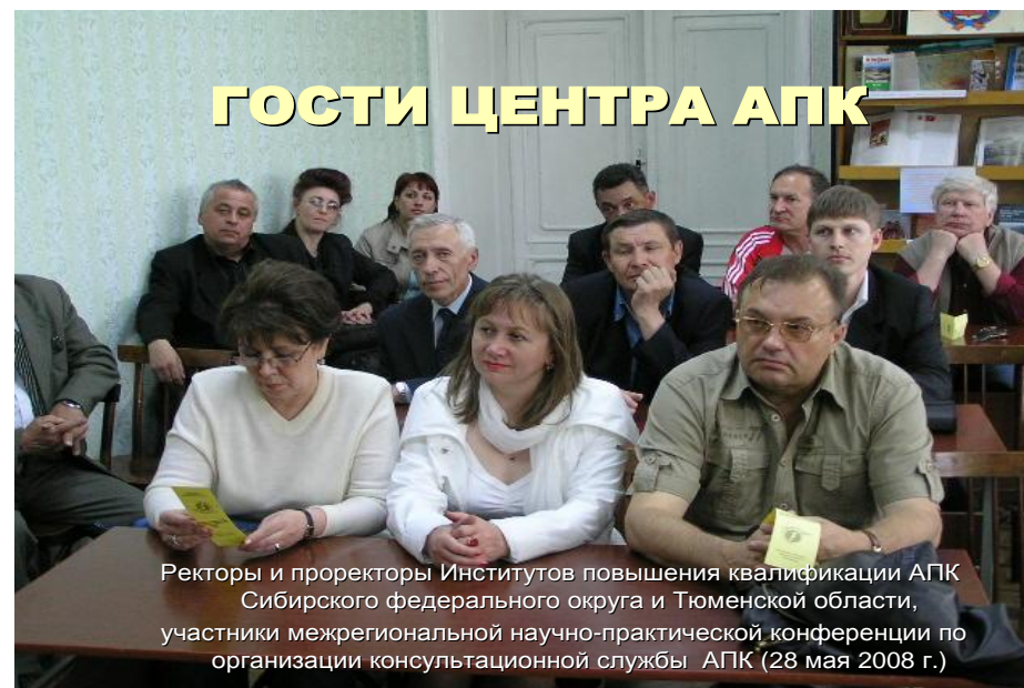
Гости ИКЦ АПК

В 2008 году библиотека принимала гостей, мы делились своими наработками в плане информирования работников АПК, которая прошла в рамках межрегиональной научно-практической конференции ректоров и проректоров институтов повышения квалификации работников АПК Сибирского федерального округа и Тюменской области.